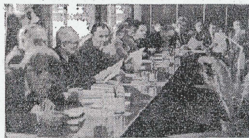
Идет заседание Ученого Совета.

20 июня 1974 года двенадцать по счёту высшее учебное заведение нашего города начало прием заявлений абитуриентов, а 3 декабря в торжествен-